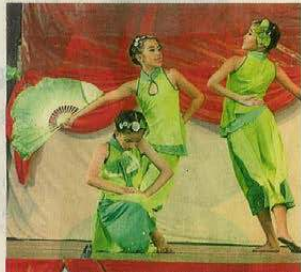
尊孔华小学生多才多艺，呈献古典美的“茉莉花”舞蹈。