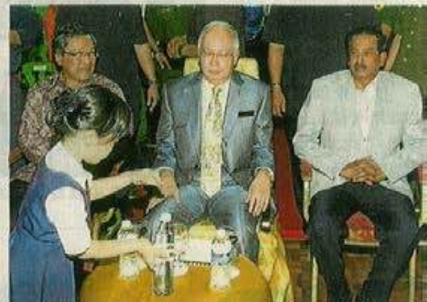
尊孔华小委派学生接待林国泰（左起）、纳吉和巴拉尼威。