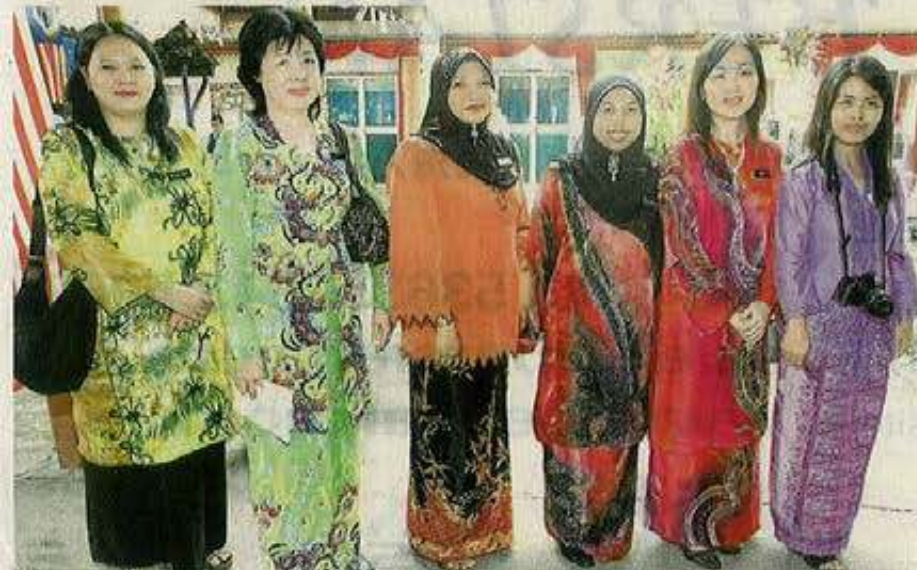
教师身穿峇迪装，迎接首相的莅临。