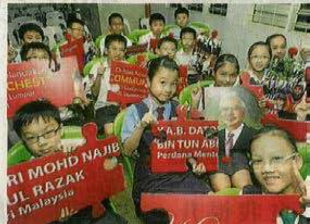
学生持着“感谢首相见证动力教育公益金”的拼图，准备拼成一幅巨图，纪念这历史的一刻。