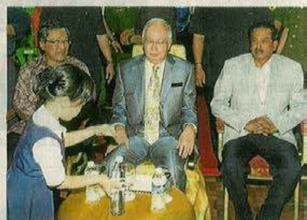
尊孔华小委派学生接待林国泰（左起）、纳吉和巴拉尼威。