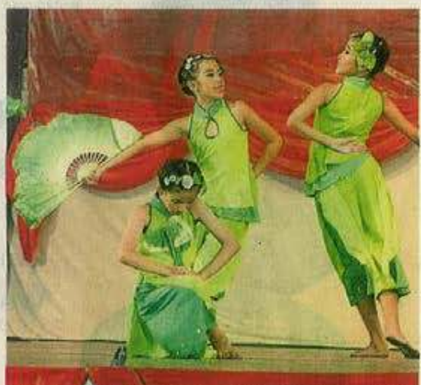
尊孔华小学生多才多艺，呈献古典美的“茉莉花”舞蹈。