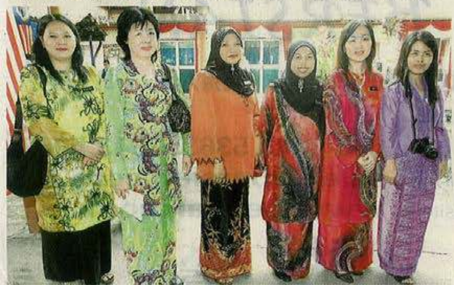
教师身穿峇迪装，迎接首相的莅临。