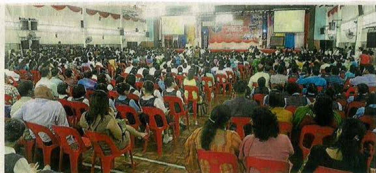
受惠学校代表、学生及家长踊跃出席，尊孔华小礼堂内外，满是人潮。