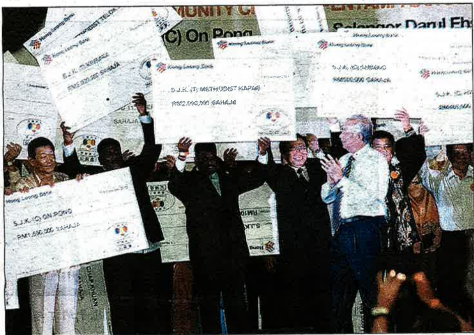
纳吉 (前排右) 在安邦国民型华小礼堂向高举公益金捐助模拟支票的78所雪州和联邦直辖区的受惠学校代表, 鼓掌祝贺。

他也说, 公益金维持低的营运成本, 并与民间和私人企业合作, 避免出现70%盈利用在营运成本, 30%盈利用在教育用途的情况。