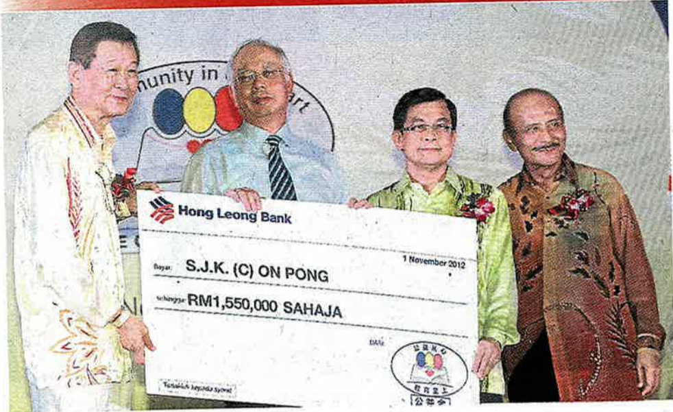
安邦华小董事长叶玉来(左一)及校长陈润强(右二)在公益金荣誉信托人敦韩聂夫(右一)见证下,从首相纳吉(左二)手中接过155万令吉的模拟支票。