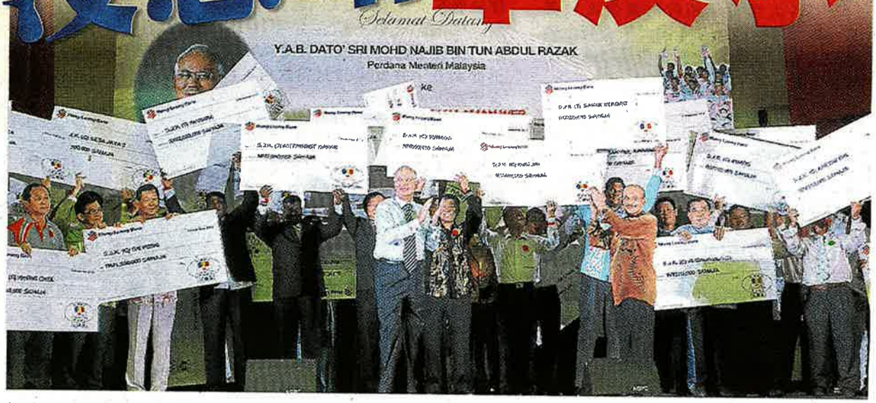
推介公益金网站仪式上，发表上述谈话。

他指出，校龄已有百年的安邦华小，一直对华社有所贡献，而政府之前已拨款200万令吉给安邦华小，公益金也发出捐款给该华小。