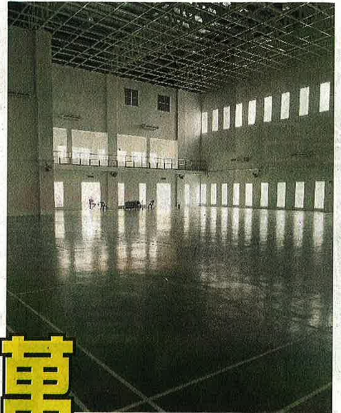
多元化室内运动礼堂。