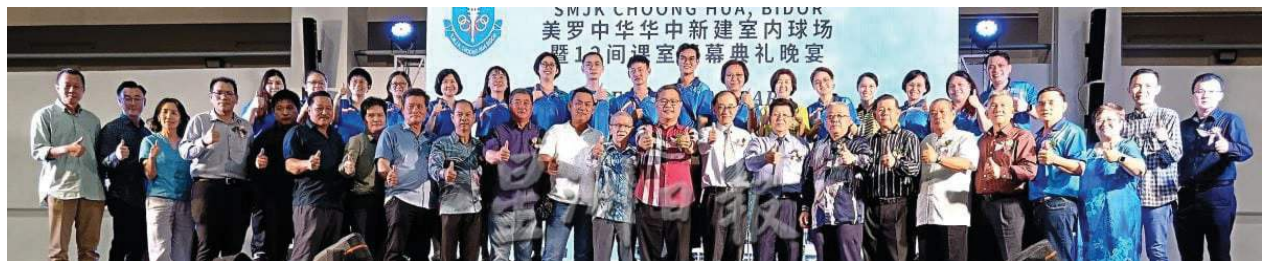
嘉宾、热心人士、董家协理事及工委会成员在台上合影。